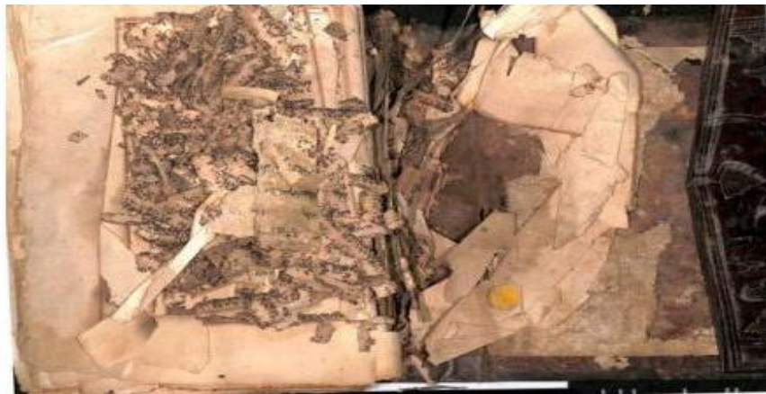
Gambar 2. Lembaran mushaf yang rusak

Keadaan naskah menunjukkan kondisi fisik manuskrip mushaf Al-Qur'an koleksi Museum Sejarah Al-Qur'an Sumatera Utara yang tidak utuh dan tidak lengkap sebagaimana mushaf pada umumnya. Bagian awal mushaf telah hilang, yaitu dari surah al-Fatihah hingga surah Ali 'Imran ayat 154, sehingga mushaf ini dimulai dari surah Ali 'Imran ayat 155 sampai surah an-Nas. Selain itu, terdapat pula beberapa lembar yang hilang pada surah at-Taubah ayat 88–105 dan surah al-Isra' ayat 51–95. Di samping ketidaklengkapan tersebut, kondisi fisik naskah juga mengalami kerusakan berupa robekan pada sejumlah bagian. Kerusakan ini kemungkinan disebabkan oleh usia naskah yang sudah tua serta faktor penyimpanan pada masa sebelumnya.