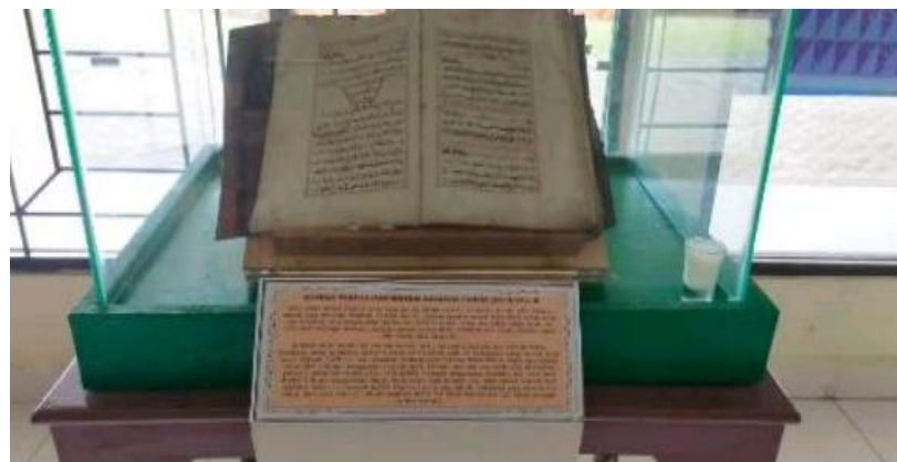
Gambar 1.

Pada umumnya, manuskrip-manuskrip disimpan di perpustakaan, museum, atau institusi pendidikan tinggi. Saat ini, manuskrip Al-Qur'an tersebut menjadi koleksi Museum Sejarah Al-Qur'an Sumatera Utara. Naskah ini ditempatkan dengan rapi di dalam kotak kaca dan dilengkapi dengan label berisi nama manuskrip, yaitu "Manuskrip Tertua dan Misteri Kolofon 1070 H/1074 H", beserta deskripsi singkat mengenai isi dan karakteristiknya.