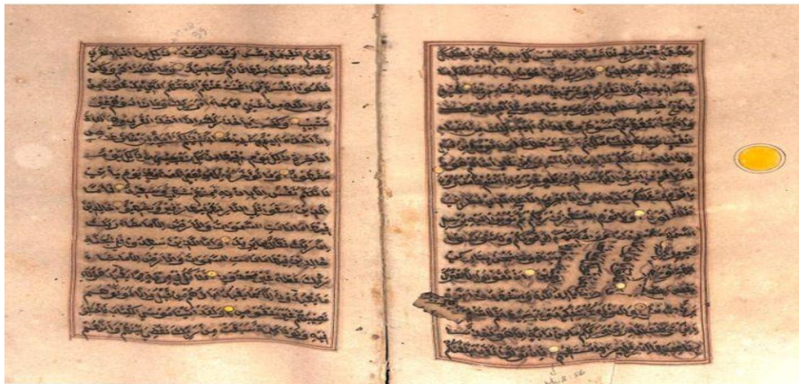
Gambar 3. Salah Satu Bagian Halaman Tersayat

Mushaf ini ditulis dengan menggunakan khat naskhi, jenis tulisan yang umum digunakan dalam penulisan mushaf di wilayah Nusantara. Sebelumnya, penyalinan Al-Qur'an pada masa-masa awal lebih banyak memakai khat kufi karena bentuk hurufnya yang sederhana dan mudah dibaca. Secara keseluruhan, mushaf ini masih berada dalam kondisi baik dan teksnya dapat dibaca dengan jelas. Huruf-huruf yang masih utuh tampak tegas karena tinta yang digunakan masih cukup kuat. Namun, pada beberapa halaman tinta hitam mulai memudar sehingga membuat kertas menggelap, bahkan terdapat bagian yang sobek.