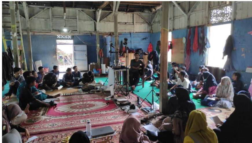
Pembersihan naskah sebelum dilakukan katalogisasi di Surau Simauang - Penyampaian materi katalogisasi naskah di surau simauang oleh peneliti dari UNAND 2019.

Pada katalogisasi ini pendeskripsian isi naskah biasanya dibuat dalam bentuk abstrak atau penjelasan singkat mengenai isi naskah tersebut. Tujuannya adalah agar para peneliti, mahasiswa, atau siapapun yang ingin mengkaji suatu naskah yang dibutuhkan dapat dengan mudah melakukan penilaian sebelum membaca naskah asli dengan membaca abstrak tersebut. Selain tujuan tersebut, manfaat lain dari pembuatan katalog naskah kuno ini untuk mengetahui keberadaan suatu naskah yang sudah didigitalkan. Biasanya ini berbentuk katalog online.